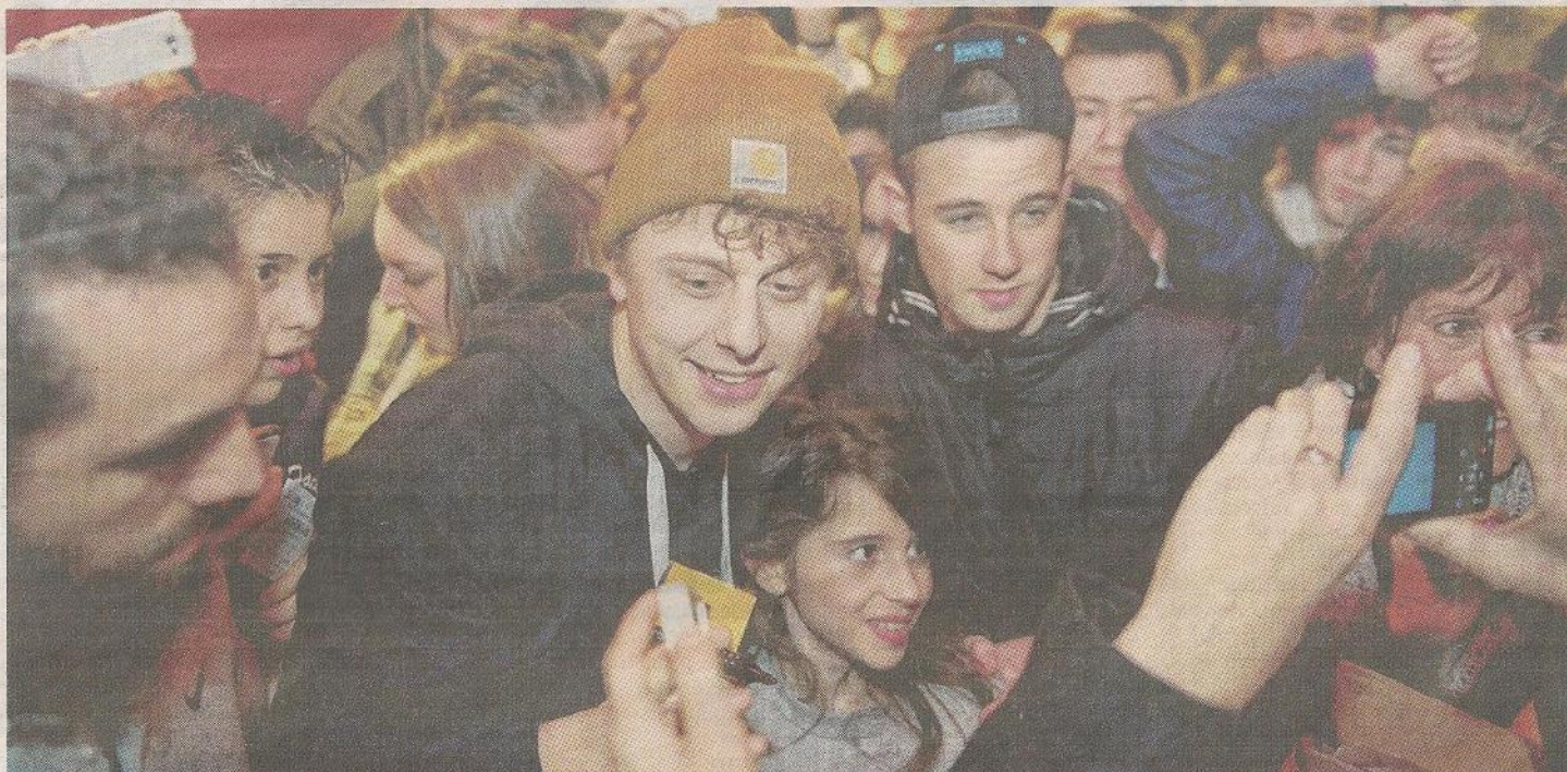
Avignon, le 28 janvier. Visiblement à l'aise avec son public, Norman (avec le bonnet orange) se prête de bon cœur aux dédicaces, photos et selfies avec ses fans.